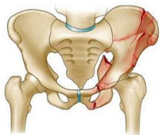
شکستگی ناپایدار لگن